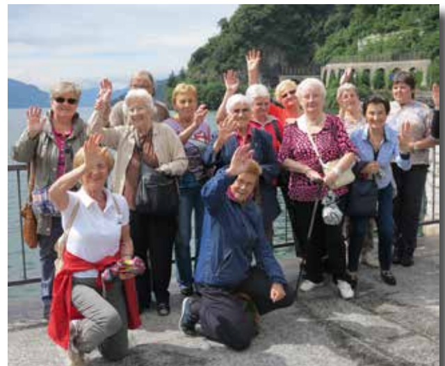
Gita al lago di Como

L'inizio dei lavori è previsto per il 2017 mentre l'apertura della tanto attesa nuova struttura è fissata per il 2019.