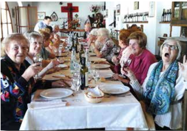
Gita a Casale Monferrato

Lo stesso vale anche per gli altri due corsi di stimolazione della memoria, destinati a persone che mantengono buone abilità cognitive: sono molto gettonati e godono di un'ottima partecipazione.