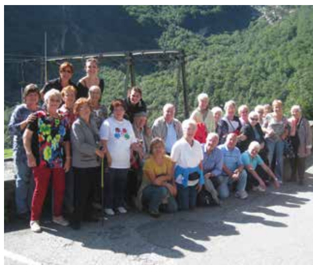
Valle Bavona, estate 2015