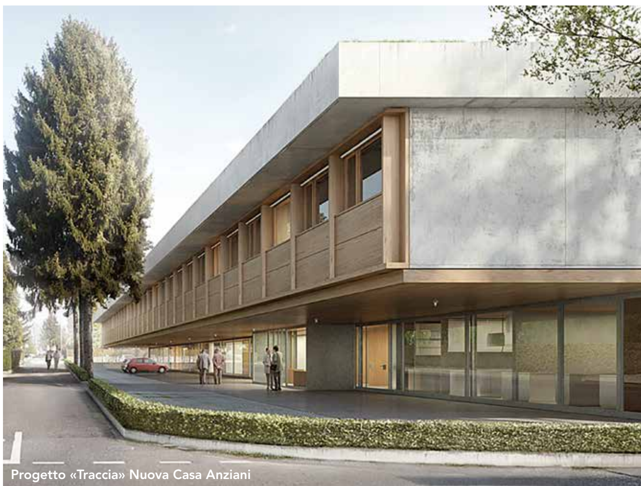
Progetto «Traccia» Nuova Casa Anziani