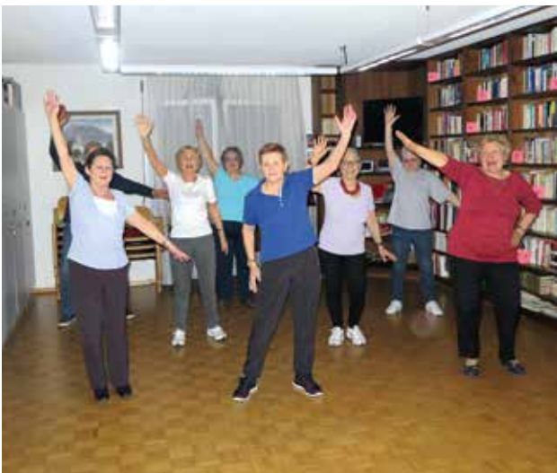
Gruppo di Ballo Zumba

La nuova attività di movimento intrapresa l'anno scorso ha permesso al gruppo di ballo di portare in tournée, presso una decina di case anziani, delle coreografie che hanno saputo suscitare entusiasmo sia tra gli ospiti che tra gli operatori.