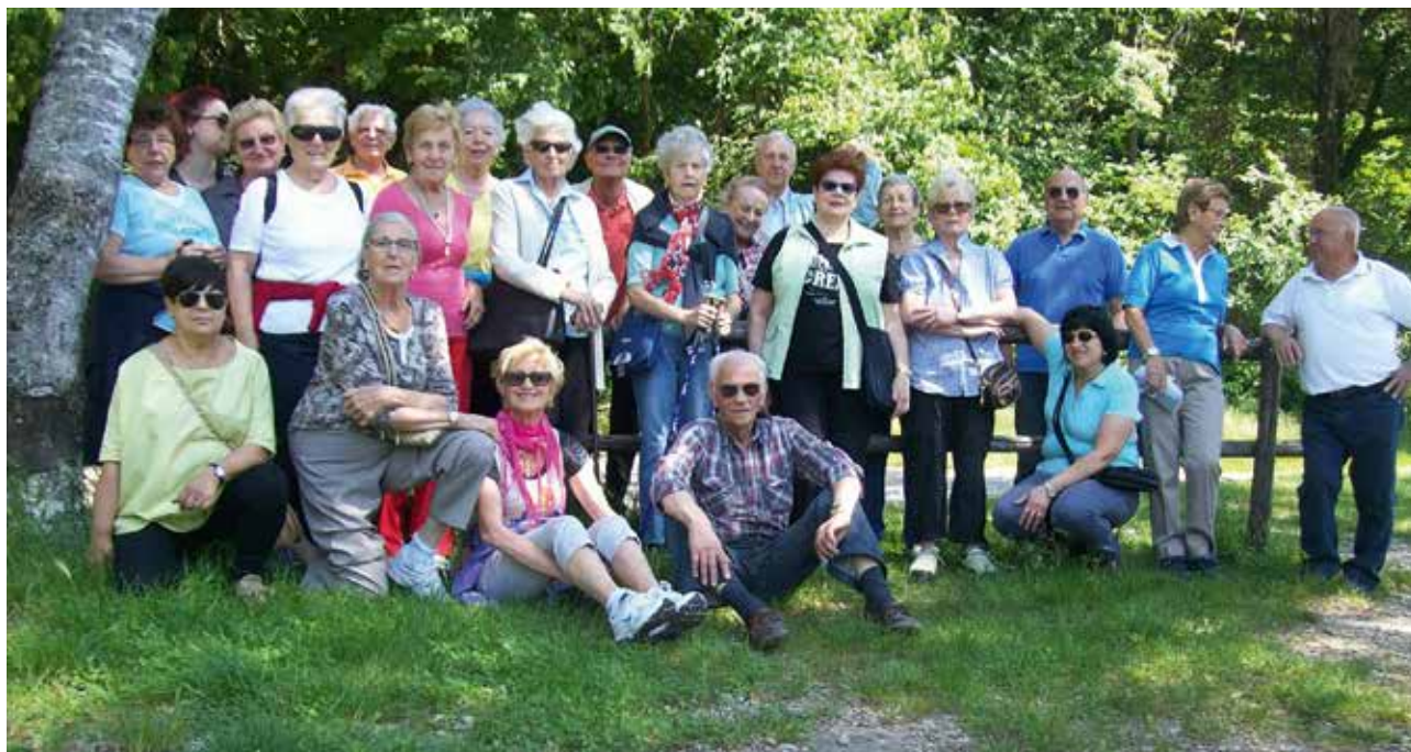
Giro del Monte Sassalto