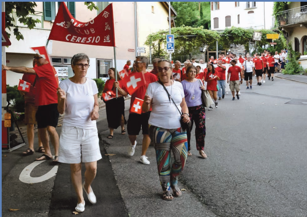
– Corteo Festa Nazionale