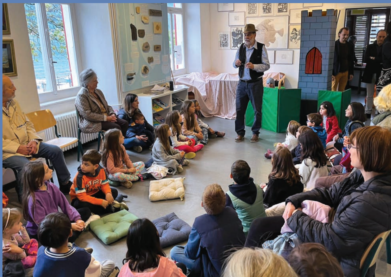
– Attività al Museo della Pesca