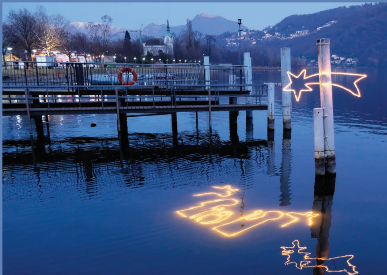
– Presepe nel lago dell'Associazione Corallo Sub