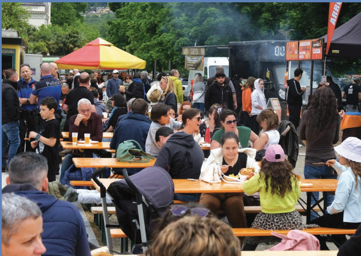
– Piazza Food