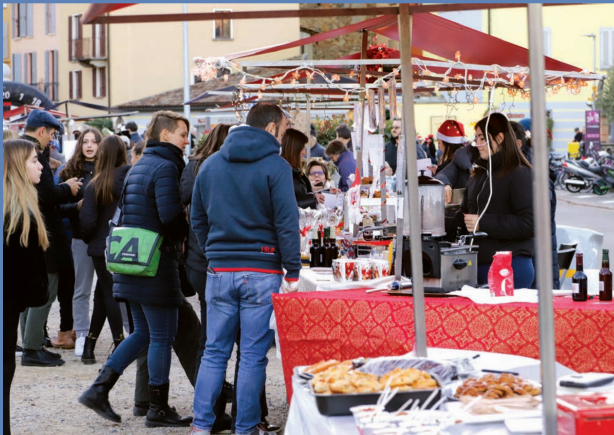
– Mercatino di Natale