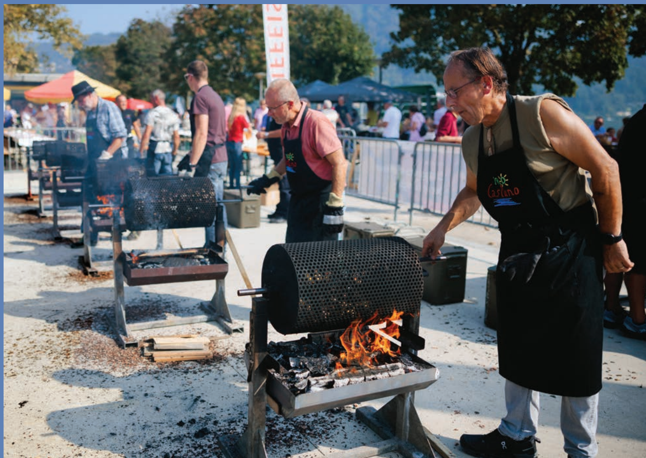
– Castagnata in Piazza lago