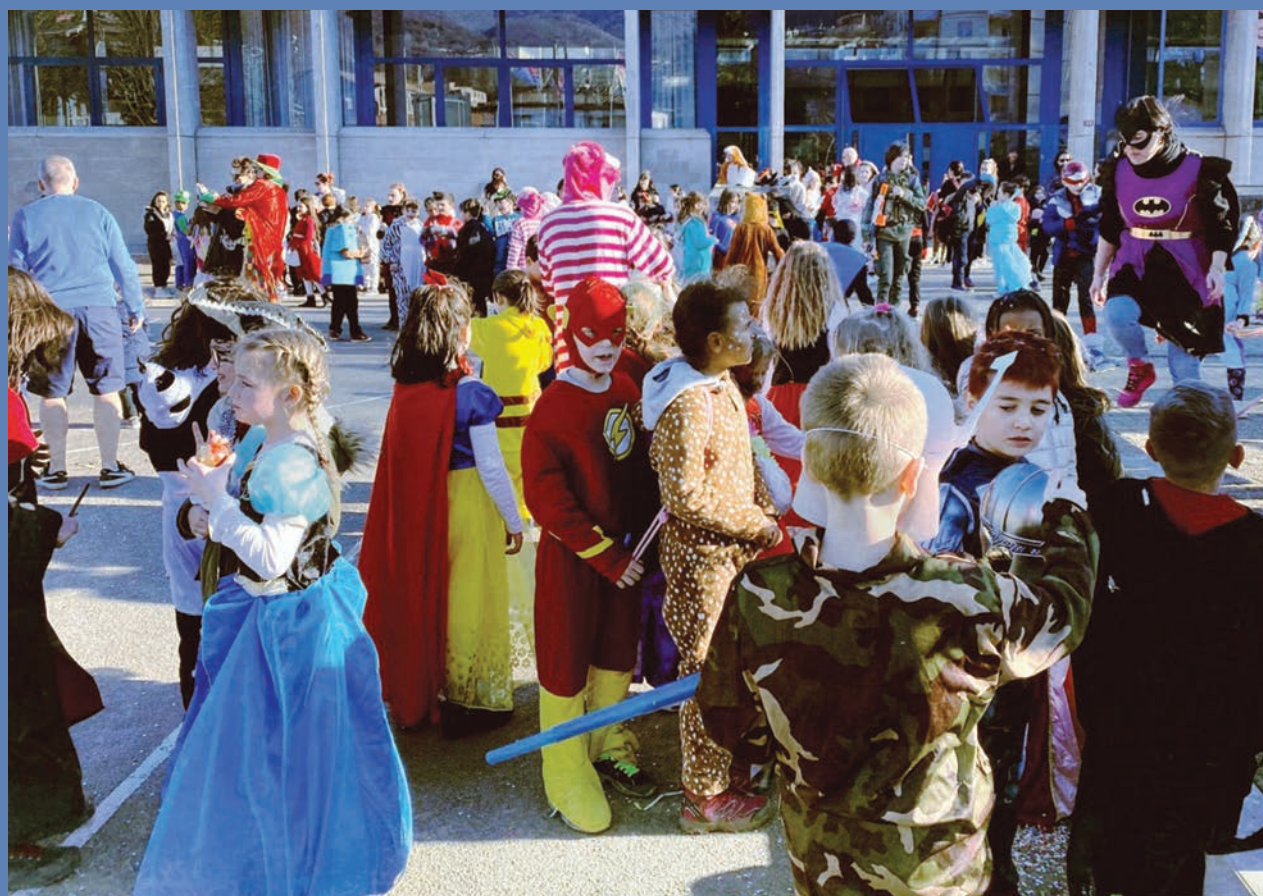
– Carnevale alla Scuola elementare