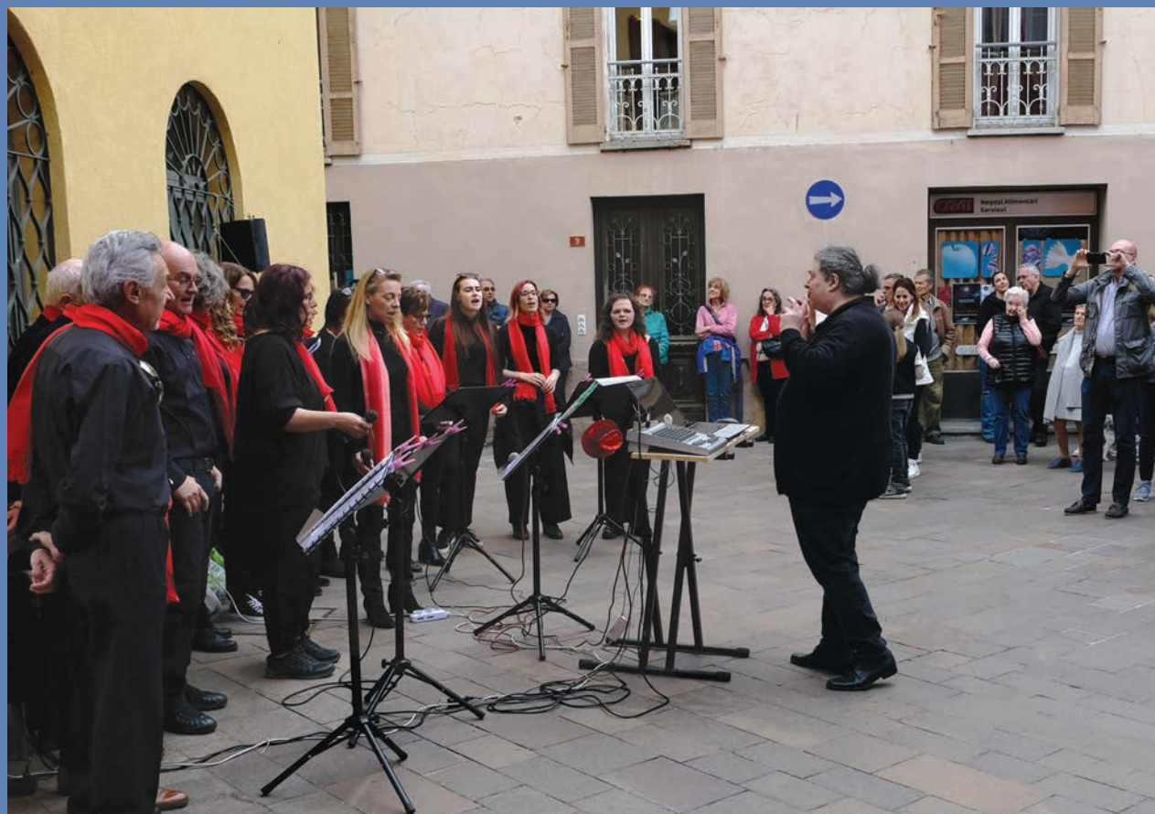
– Coro San Cristoforo