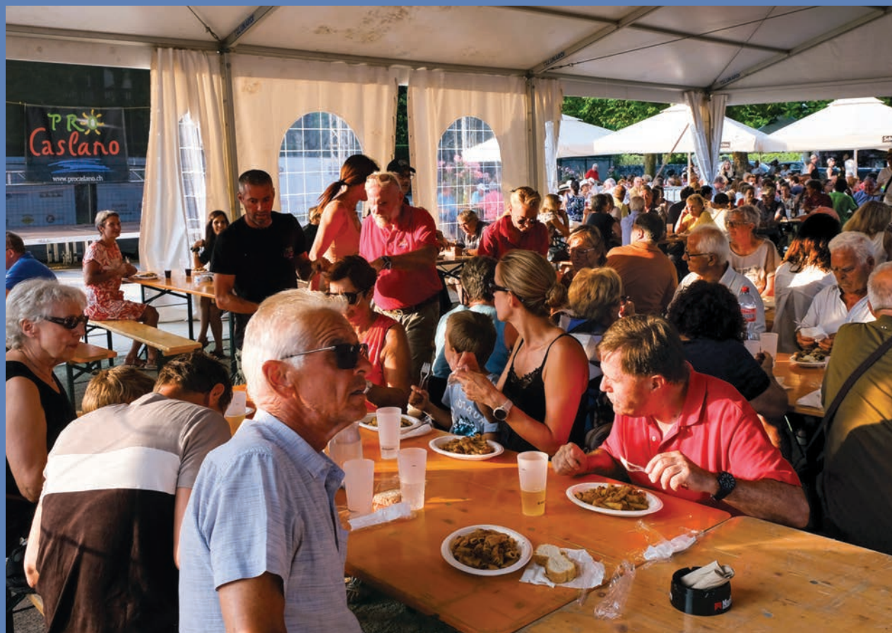
– Maccheronata per San Cristofenin