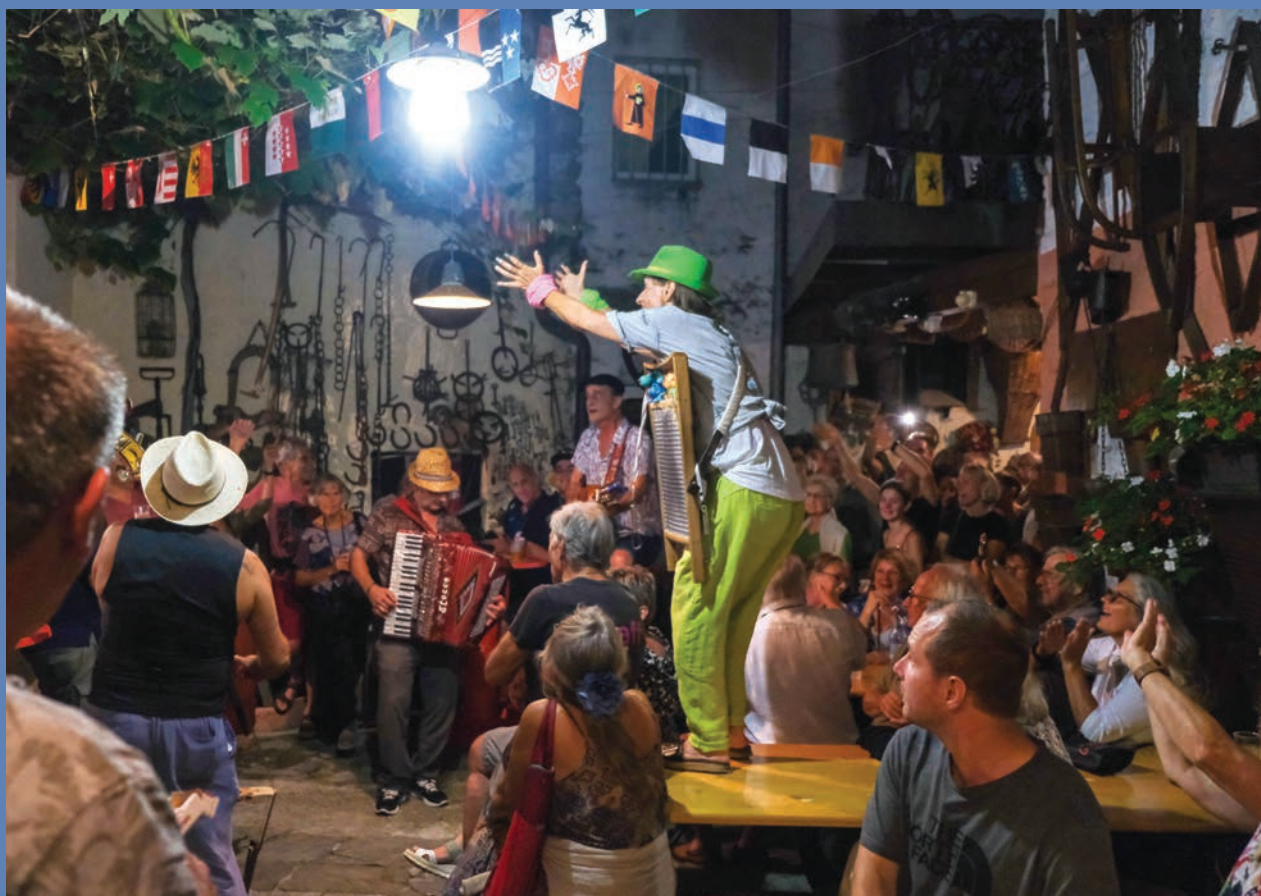
– Festa nelle Corti