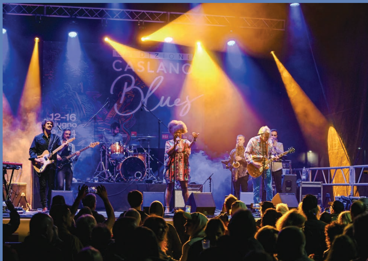
– Blues in Piazza lago