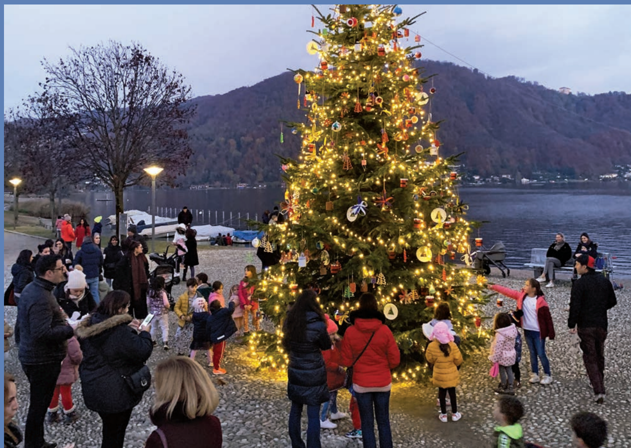
– Albero di Natale addobbato dagli allievi