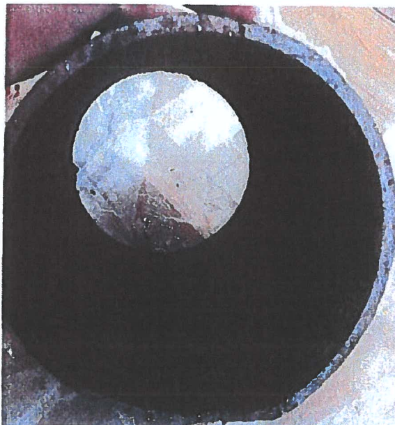
figura 1: condotta AP Via Nosetto

L'immagine mostra la tubazione DN 125 che, contrariamente a quanto si riteneva, era una condotta in ghisa duttile senza rivestimento interno in PUR. Ciò la rende più soggetta alla corrosione. Si possono infatti notare le prime tracce di ossidazione presenti sulla superficie interna della condotta.