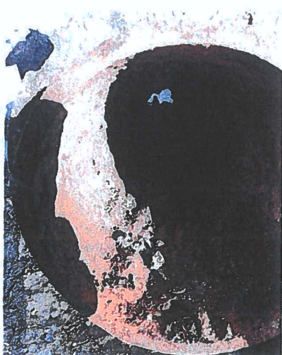
figura 2: condotta AP Via Stazione

Il mantenimento di tale condotta avrebbe portato nel giro di alcuni anni al peggioramento della condizione, come mostra la tubazione del medesimo tipo, sostituita nei mesi scorsi in Via Stazione. Le immagini sottostanti ritraggono: un campione di condotta in ghisa duttile, rimossa in Via Stazione ( figura 2 ) e una condotta con rivestimento interno in PUR di qualche anno più recente rispetto a quella di Via Stazione ( figura 3 ). Si può notare che la superficie a contatto con l'acqua, completamente libera da incrostazioni.