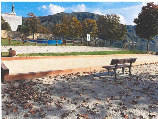
Ubicazione per nuovo quadro elettrico principale elettrico