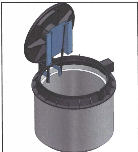
Nuovo pozzetto di distribuzione elettricità