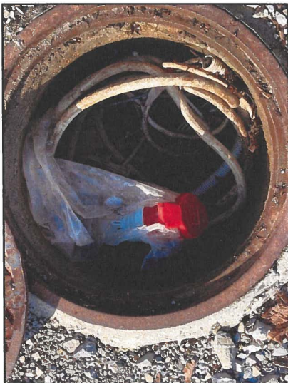
Pozzetto esistente alimentazione quadri elettrici di distribuzione