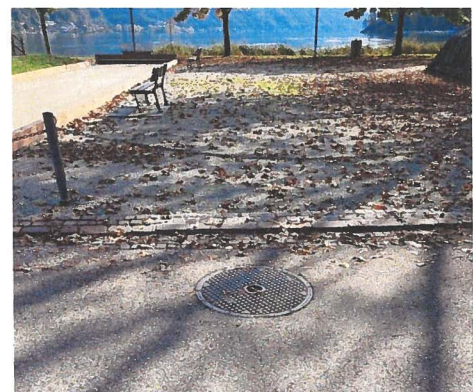
Camera AIL per allacciamento del nuovo quadro alimentazione piazza lago