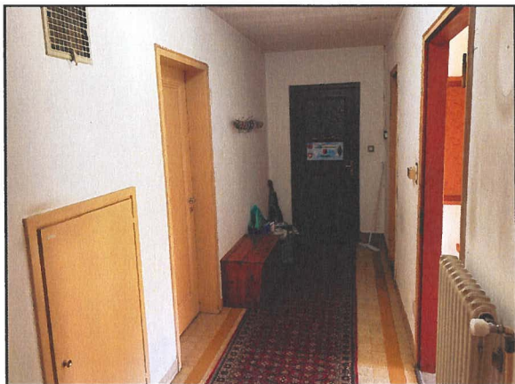
Vista situazione spazi interni