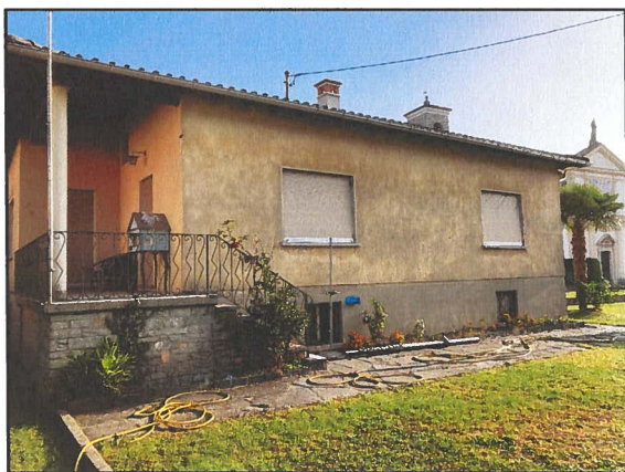
Vista facciata esterna