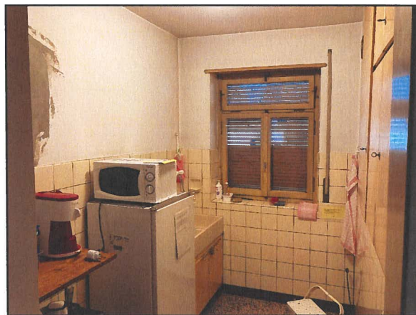
Vista situazione locali interni e serramenti interni