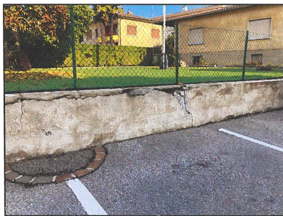
Situazione muro a confine con posteggi